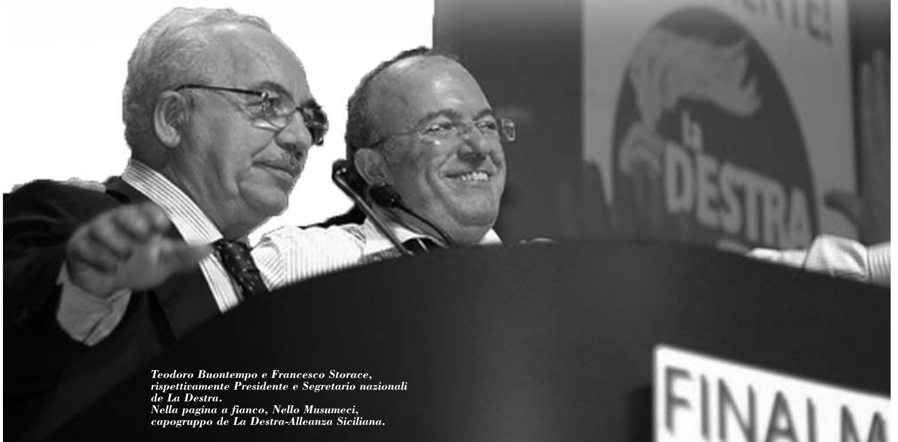
Teodoro Buontempo e Francesco Storace, rispettivamente Presidente e Segretario nazionali de La Destra. Nella pagina a fianco, Nello Musumeci, capogruppo de La Destra-Alleanza Siciliana.

sto, nel '95 alcuni scelsero un'altra via. Noi abbiamo sempre preferito Roma a Montecarlo, noi abbiamo sempre anteposto gli interessi dell'Italia e della nostra Europa a quelli di altre Nazioni. Noi non siamo tra quelli, come forse fu la contesa Colleani e tanti che in perfetta buona fede condivisero la radicale trasformazione del progetto politico del MSI. Noi non accettammo di seguire un leader e chiudere esperienze e sogni per costruire una proposta liberale di cui non c'era alcuna necessità, già presente e ben rappresentata in Italia da altri Partiti e Movimenti. Soprattutto Noi non accettammo di rinunciare al profondo senso di giustizia e alla grande prospettiva umana e civile di vero progresso per la nostra Nazione che promana dall'articolo 1 dello statuto del MSI. Tutto qui il vero senso di una scelta, tutta qui la continuità che cercavamo e difendiamo.